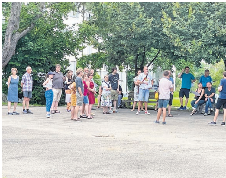
Meienegg-Idylle. Die erste rein genossenschaftlich organisierte Mehrfamilienhaus-Überbauung mit viel gemeinschaftlich genutztem Aussenraum war damals Vorbild für viele andere soziale Wohnbauprojekte.

lenkbus 251 in der Stadt Bern im Einsatz, so lange wie kein anderes Pneufahrzeug. Dabei hat er über eine Million Kilometer zurückgelegt. Der vom Personal zärtlich «Grossmutter» genannte Prototyp ist ein Einzelstück und entwickelte sich sofort zum Liebling sowohl der Chauffeure wie der Fahrgäs-