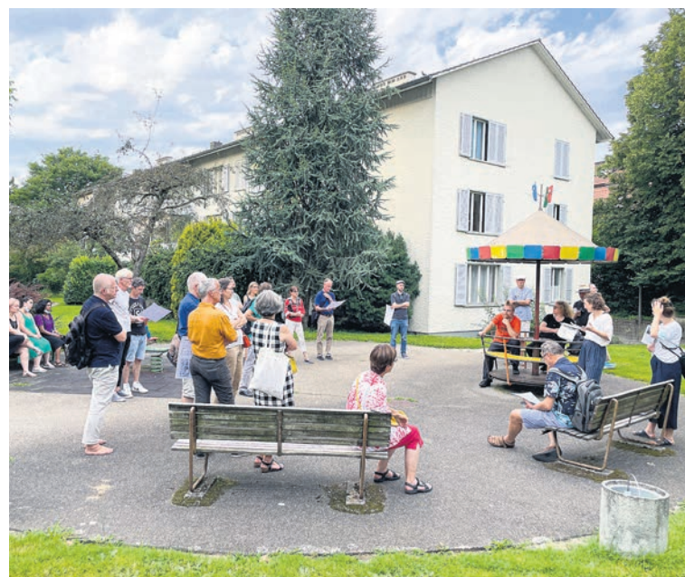
Noch dreht sich das alte Karussell mitten in der Meyenegg. Wohin kommt es, wenn die Siedlung abgerissen und neu gebaut wird?